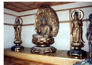
浄楽寺阿弥陀如来像

雨天時: 雨天中止 健脚向き 歩行行程約 7.5 Km 集合場所への案内: 京急横須賀中央駅⇒衣笠城址バス停 20分 バス代 280円 解散後の交通案内: 浄楽寺バス停⇒逗子駅 30分 バス代 490円 その他費用: 浄楽寺志納金 500円