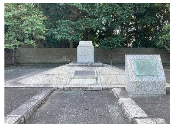
明治憲法起草地記念碑

雨天時: 雨天中止 健脚向き 歩行行程約 8.0 Km 解散後の交通案内: 追浜車庫バス停⇒追浜駅 8分 220円 あるいは徒歩30分程度