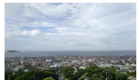
矢ノ津坂から見た景色

シリーズ第3弾! 募集50名 締切1月10日(木) 新年の「浦賀みち3」、古絵図を参考に「矢ノ津坂」を經由し東西浦賀を巡り、常福寺閻魔堂、新装予定の叶神社でお参り。 (雨天中止時 振替日:1月21日(月)) ・集合:9:30(京急線 堀ノ内駅) 解散:14:30頃(紺屋町バス停) ・コース:堀ノ内駅～安房口神社～矢ノ津坂～浦賀駅～八雲神社～東叶神社 ～(渡船)～船番所跡(昼食)～浦賀奉行所跡～常福寺～西叶神社 ～紺屋町バス停(解散) (行程 約10Km) ・その他費用:渡船料(大人200円、子供100円)