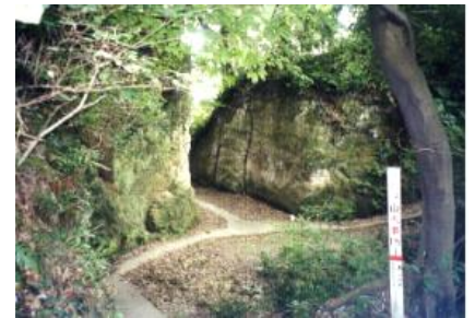
浦賀みちの難所「がらめき」

シリーズ第1弾! 募集60名 締切11月9日(金) 秋の「浦賀みち」、難所と言われた「がらめき」「十三峠」を歩き、絶景の江戸湾(東京)を眺めます。(雨天中止時 振替日:11月21日(水)) ・集合:9:30(京急線 追浜駅前デッキ) 解散:15:00頃(ウエルシティ前広場) ・コース:追浜駅前デッキ～雷神社～築島～浦郷陣屋跡～良心寺 首斬り観音 ～がらめき～「青木坂」付近～池ノ谷戸公園(昼食)～盛福寺 ～静岡寺下馬頭観音～長善寺～大田坂～十三峠～塚山公園 ～鹿島神社～浄土寺～ウエルシティ前広場(解散)(行程 約10Km)