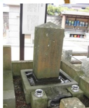
正業寺(しょうごうじ)

本堂横にタイから運んだ像が沢山ある。境内右手に菊化石と、不動明王が安置されている不動堂がある。墓地には戦後の浦賀港引揚者精霊塔が立つ。